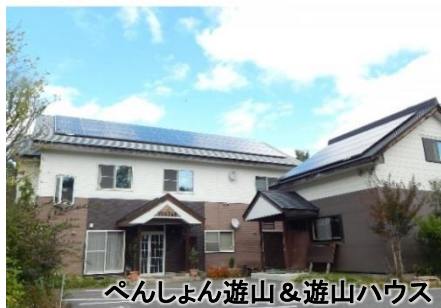
ペンしょん遊山&遊山ハウス

〒380-0888 長野市上ヶ屋(アゲヤ)2471-2998 電話026-239-3351 http://yuuzann.com