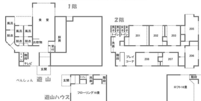
ペンしょん遊山&遊山ハウス間取り図

グループ旅行なら 飲み会OKの 遊山ハウスを ご予約ください ※ペンしょん遊山での 「飲み会」は他のお客 様の迷惑になる為、 出来ません ※夕食時の食堂へ のお飲物の持込みは ご遠慮ください