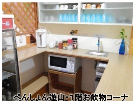
ペンしょん遊山・1階お飲物コーナー

お食事は一度にセットされた和洋折衷料理 ですので気がねなくお楽しみ頂けます コース料理のようにお待たせする事や かえって肩が凝ったなんて事ありません ご飯とお飲物はセルフです ご自由にどうぞ