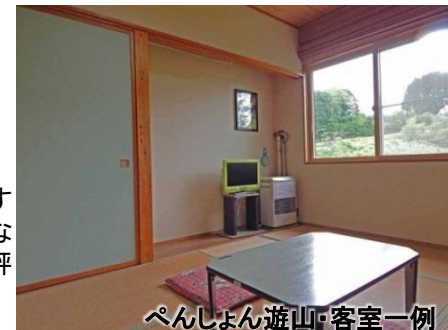
ペンション遊山・客室一例

お部屋は足を延ばしてくつろげる和室です さっぱりした感じで、好奇心旺盛な お子さんがいるファミリーにも好評