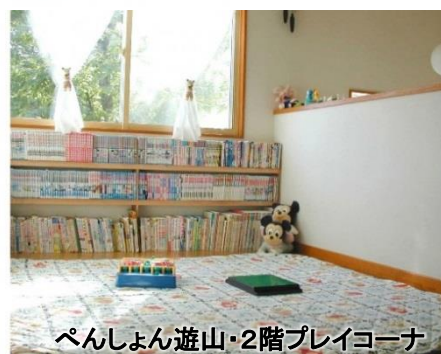
ペンしょん遊山・2階プレイコーナー

お部屋は足を延ばしてくつろげる和室です さっぱりした感じで、好奇心旺盛な お子さんがあるファミリーにも好評